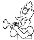
鴨中吹奏楽部演奏